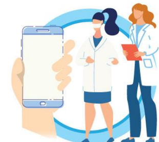
В СЛУЧАЕ ЗАБОЛЕВАНИЯ ОБРАЩАЙТЕСЬ К ВРАЧУ