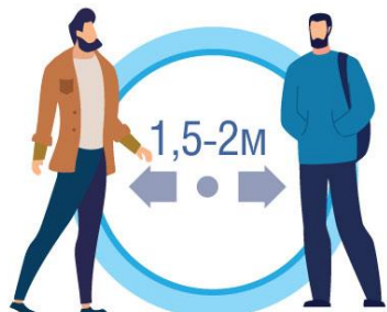
СОБЛЮДАЙТЕ РАССТОЯНИЕ И ЭТИКЕТ